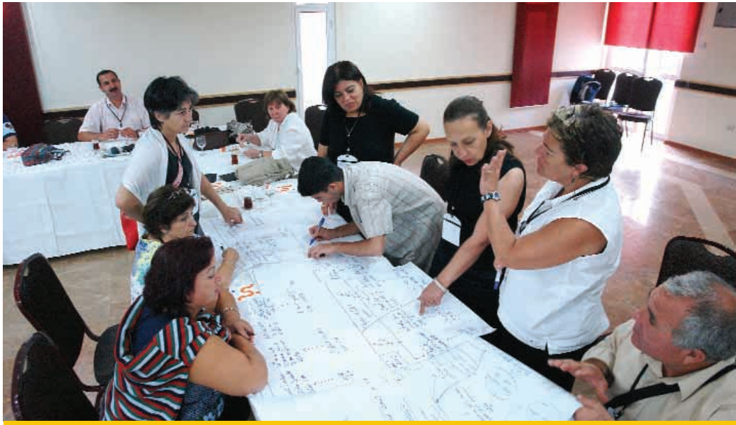
Sivil Toplum Geliştirme Merkezi'nce Muğla'da düzenlenen bir eğitim.

STD hibeleri dışında, 2006'da 2.5 milyon Euro bütçeye sahip olan "Türkiye'de Kültürel Hakların Geliştirilmesi" adlı bir diğer program başlatılmıştır. Bu programın amacı, Türk Hükümeti'ne, kültürel haklar alanındaki mevzuat reformlarını uygulamada destek sağlamaktır. Bu programın iki bileşeni bulunmaktadır: kültürel girişimler ve Türk vatandaşlarının günlük hayatlarında geleneksel olarak kullandığı diller ve lehçelerde yayın yapma. Bu kapsamda Türkiye'deki karşılıklı anlayış ve bilgiyi destekleyen projeler desteklenmektedir.