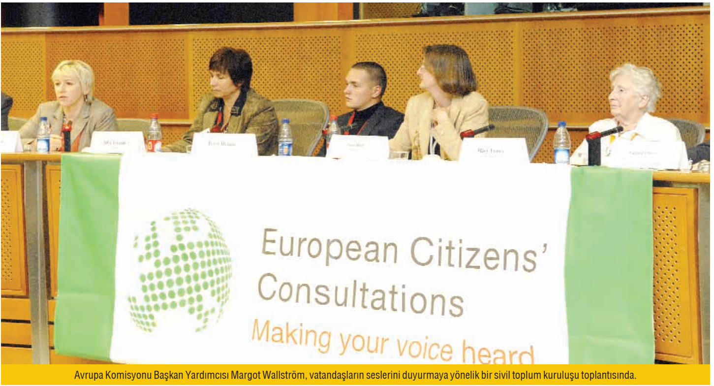
Avrupa Komisyonu Başkan Yardımcısı Margot Wallström, vatandaşların seslerini duyurmaya yönelik bir sivil toplum kuruluşu toplantısında.