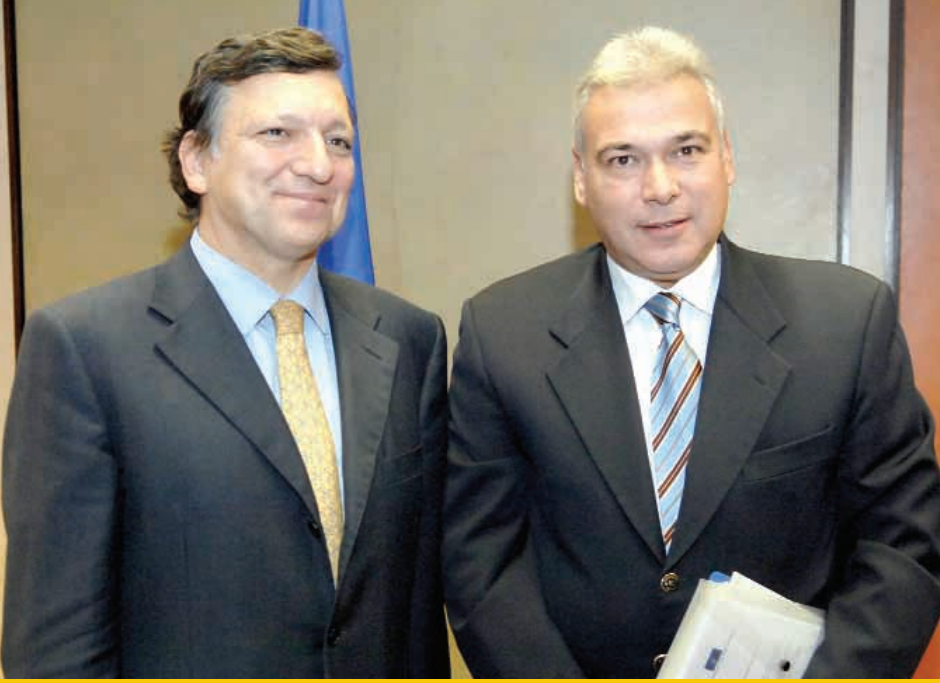
Avrupa Komisyonu Başkanı José Manuel Barroso ve EESC Başkanı Dimitris Dimitriadis.

Ortalama olarak, EESC yılda 170 tavsiye niteliğinde belge ve görüş beyan eder ve bunların yüzde 15'i Komite'nin kendi inisiyatifleridir. Tüm görüşler AB'nin karar alma organlarına gönderilmekte ve daha sonra da AB'nin Resmi Gazetesi'nde yayımlanmaktadır.