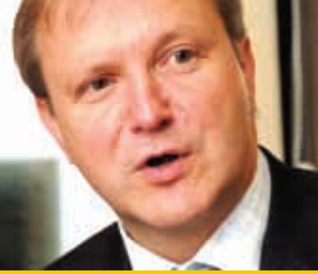
Genişlemeden Sorumlu Komisyon Üyesi Olli Rehn.

27 Üye Ülke ve 500 milyona yakın bir nüfusu ile bugünün Avrupa Birliği, 50 yıl öncesinin 6 Üye Ülke'den oluşan ve 200 milyondan az bir nüfusa sahip olan Avrupa Ekonomik Topluluğu'ndan çok daha güçlü ve etkili bir durumdadır.