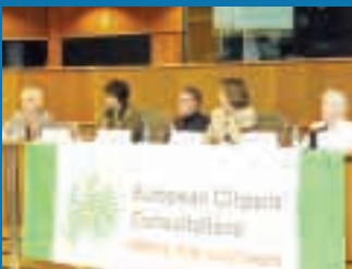
Sivil Toplum: AB'ye katılım görüşmelerindeki eksik halka mı?